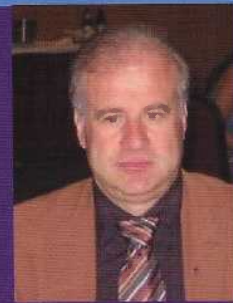
Adérito Custódio Cavaco Presidente