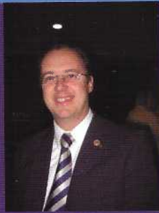
Mauro Figueiredo Presidente